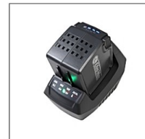
充电器可以挂在墙上。

为Bi 2.5 OM和Bi 5.0 OM两款电池充电, 并使其保持完美状态。使用最新的电子元件意味着电池是在完全安全的情况下充电, 最大限度延长电池寿命, 减少主电源消耗。FAST CRG充电器能节省充电时间: 这意味着它只需要50分钟来即可充满2.5 Ah电池。通过GS和ETI认证, 充电器有中国、欧盟和美国三种标准的插头类型。