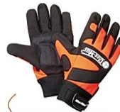
功能型锯链防护手套

欧盟CE认证；防水皮革鞋面，透气无纺布衬里，高强度织物防刺穿鞋底。8层链条保护，从脚尖到小腿两侧。适用于森林和园林工作以及休闲时穿着，可适应多种天气环境。