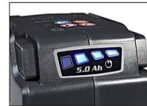
充电过程中动态显示电池电量。

Oleo-Mac系列电池包括两种额定功率: 2.5Ah和5Ah, 两者的尺寸相同, 可在所有应用中互换。配有过载切断和电池充电的指示系统。当工具在使用时LED灯持续显示电池的充电状态。